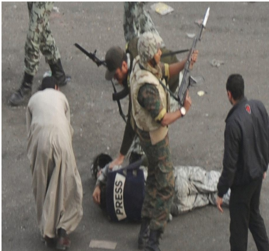
Les journalistes menacés

*Quelles menaces les journalistes subissent-ils et pourquoi ce métier est-il dangereux ou attaqué ?