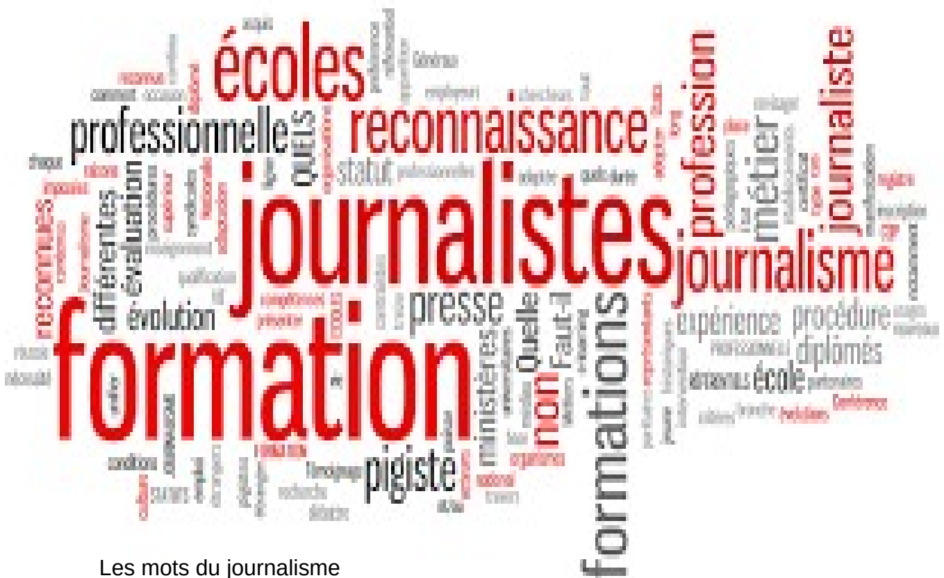
Les mots du journalisme

Il doit respecter des règles pour faire son journal. Il faut bien connaître les médias en France. Avant de publier les journalistes se posent plusieurs questions : d'où vient cette informations ? de quand date-elle ? est-elle logique et clair ? peut on retrouver cet informations ailleurs ?