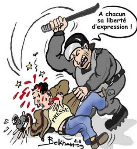
Liberté de la presse

Le métier du journaliste est un métier dangereux car quand il se déplace dans un pays en guerre pour raconter ce qu'il se passe il a les mêmes risques qu'un habitant : (explosions, emprisonnement...).