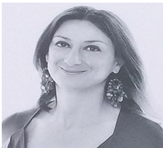
Daphné Caruana Galizia

Si les ressources des journaux sont épuisées, ils n'auront plus assez d'argent pour payer leur avocat, les amendes,... Aussi, souvent ils décident de retirer des articles publiés sur leurs sites.