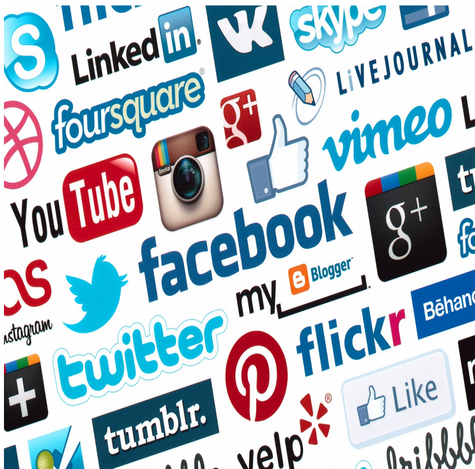
Les réseaux sociaux

Il faut éviter les journalistes qui s'intéresse sur la vie privée des personnes. Il faut se méfier des personnes qui se prend pour un vrai journaliste. Faire attention aux personnes qui prend des photos ou vidéos discrètement. Il ne faut pas croire aux publicités que les personnes publient sur les réseaux sociaux.