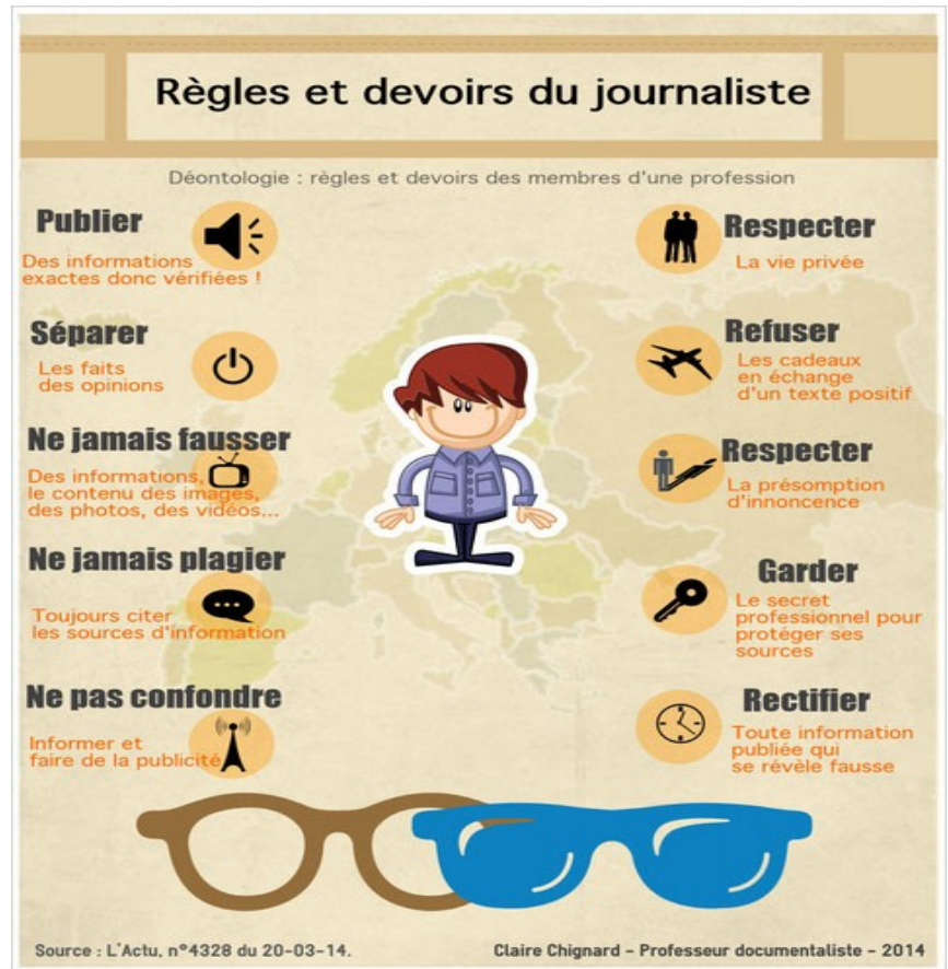
Les règles du journalistes

*Il ne doit pas supprimer les informations essentielles et ne pas altérer les textes et les documents, ne pas accepter les informations donner par d'autres personne en échange d'argents.