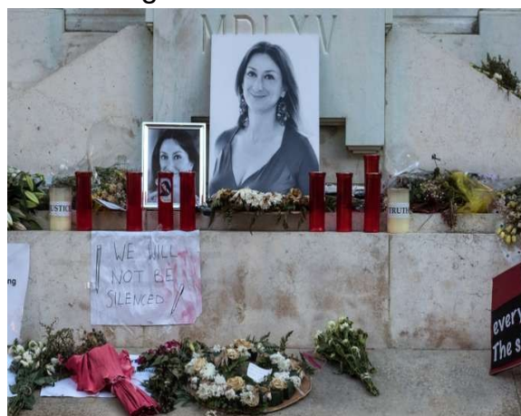
Hommage sur la place du palais de justice de La Valette

Divers policiers maltais, été accusés dans le blog de la journaliste, dénoncent ce qu'ils appellent « une attaque barbare » et « meurtre politique ».