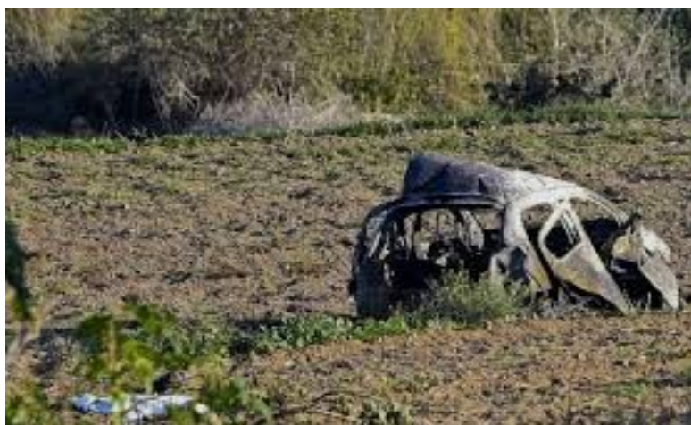
L'explosion de sa voiture

La mort a eu lieu une demi-heure après qu'elle a publié un article sur son blog.